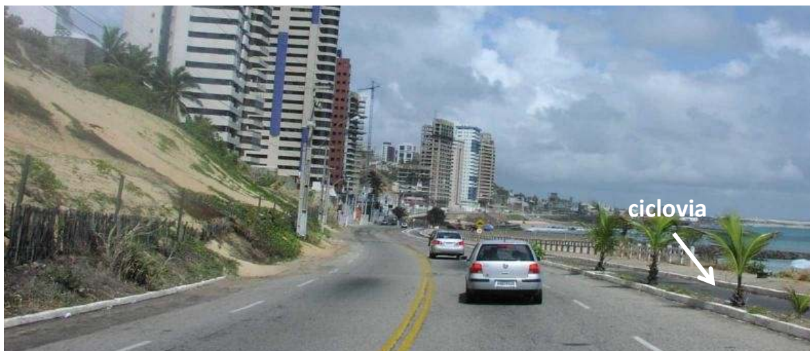
Via Costeira antes da reforma, fonte: Google imagens, Novembro 2009.

uma via de lazer. No entanto, na cidade de Natal está em tramite o plano de mobilidade que segundo um ciclista militante prevê um plano cicloviário para a cidade.