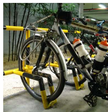
Paraciclo em Shopping, fonte: SANTANA, 2009.

Estacionamentos para bicicletas foram encontrado em dois dos quatro shoppings visitados, na cidade não foi levantado nenhum do tipo público e nas universidades somente nas particulares que é oferecido algum tipo de estrutura.