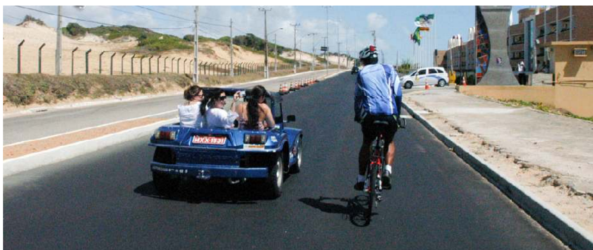
Via Costeira com a reforma, fonte: SANTANA, 2009.

Estacionamentos para bicicletas foram encontrado em dois dos quatro shoppings visitados, na cidade não foi levantado nenhum do tipo público e nas universidades somente nas particulares que é oferecido algum tipo de estrutura.