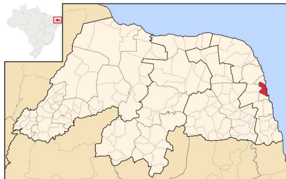
Mapa de localização, fonte: www.wikipedia.org , Novembro, 2009.

Natal é a capital do estado do Rio Grande do Norte, localizada na mesorregião do Leste Potiguar e ao Pólo Costa das Dunas. A cidade nasceu as margens do rio Potengi e do Forte dos Reis Magos, no extremo-nordeste do Brasil numa região chamada "esquina do continente", com uma população aproximada de 807.000 mil habitantes e 506.000 mil na região metropolitana.